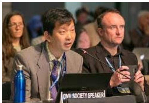
Talanoaのオープニング全体会合 (5/2)。TUNGOを代表して ステートメントを述べる連合出席者